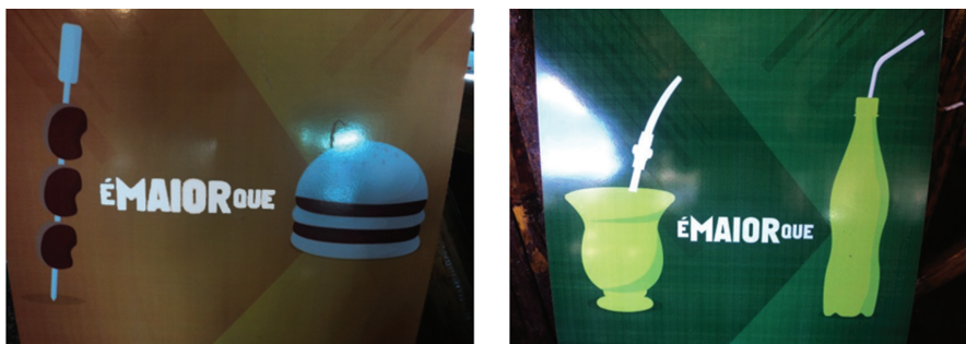
Figura 1 – Fluxos de proteção e valorização de elementos locais.