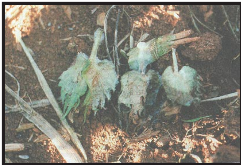
FIG. 1. Maçãs de algodoeiro Deltapine infectadas por Sclerotinia sclerotiorum .

Amostras de plantas de algodão foram coletadas no campo e levadas para análise no laboratório de Fitopatologia da Embrapa-Centro de Pesquisa Agropecuária dos Cerrados (CPAC). A partir do tecido infectado, foi feito