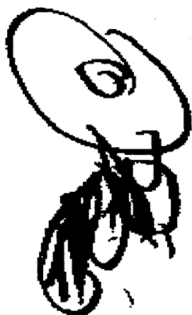
Figura 1: Desenho do Peixe

Educadora (Lendo a palavra peixe, pergunta a Janete:) - O que posso fazer com o peixe? Ele não é de verdade. Existe quadro pintado com peixes? Tem?.