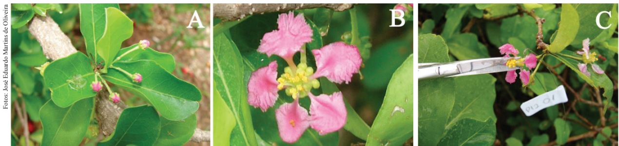
Figura 1. Flores da aceroleira Malpighia emarginata DC. Malpighiaceae, cultivar Olivier (Dracena, SP, 2012). A) botão floral em pré-antese; B) flor totalmente aberta; C) procedimento de emasculação.

A floração das aceroleiras da cultivar Olivier ocorreu nos meses de março, abril, outubro, novembro e dezembro de 2011, e janeiro e fevereiro de 2012. Entre os meses de maio e setembro, não houve floração. Nessa época de final de outono e inverno, o fotoperíodo menor, as temperaturas mais baixas e o menor volume de chuvas na região Sudeste implicam na interrupção da produção de flores. Tais fatores contribuem para que a planta permaneça em estágio vegetativo durante os meses nos quais as condições