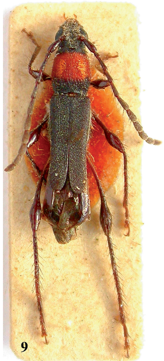
FIGURA 9: Ischasioides berkovae sp. nov., holótipo fêmea.

Fêmea (Fig. 9): Tegumento preto. Escapo, pedicelo e antenômeros III-V castanho-escuros brilhantes; antenômeros VI-XI castanho-escuros e opacos. Protórax alaranjado na maior parte, exceto as seguintes áreas negras: faixa estreita junto a borda anterior do pronoto, gradualmente mais estreita e mais acastanhada em direção ao centro do prosterno; faixa transversal que ocupa pouco mais do que o quarto basal do pronoto, mais estreita na área lateral e ventral. Terço basal do pedúnculo dos fêmures castanho-alaranjado, gradualmente mais escuro para o ápice; demais partes das pernas castanho-escuras.