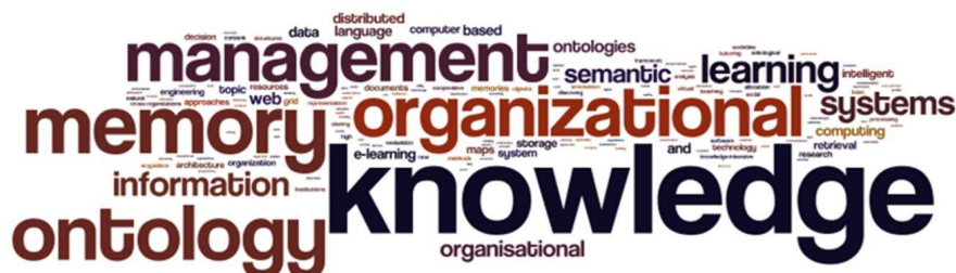
Figura 2 - Representação das palavras-chave utilizadas pelos trabalhos para artigos selecionados nas bases de dados WoS , Scopus e EBSCO para os termos “memória organizacional” e “ontologias”

Conforme ilustra a Figura 2 (nuvem de termos), o termo Knowledge (conhecimento) aparece em destaque e os autores o utilizam junto com outras palavras, principalmente com: management (gestão), engineering (engenharia), acquisition (aquisição), creation (criação), representation (representação), retrieval (recuperação), sharing (compartilhamento) e discovery (descoberta). Já o termo ontology (ontologia) é geralmente associado aos termos learning (aprendizagem), matching (combinação), similarity (similaridade) e store (armazenar). Com isso, observou-se que os trabalhos que exploraram o tema memória organizacional e ontologias foram identificados como estudos associados à engenharia do conhecimento, à gestão do conhecimento e aos processos de aquisição, criação, representação, recuperação, compartilhamento, descoberta, combinação, similaridade e armazenamento do conhecimento.