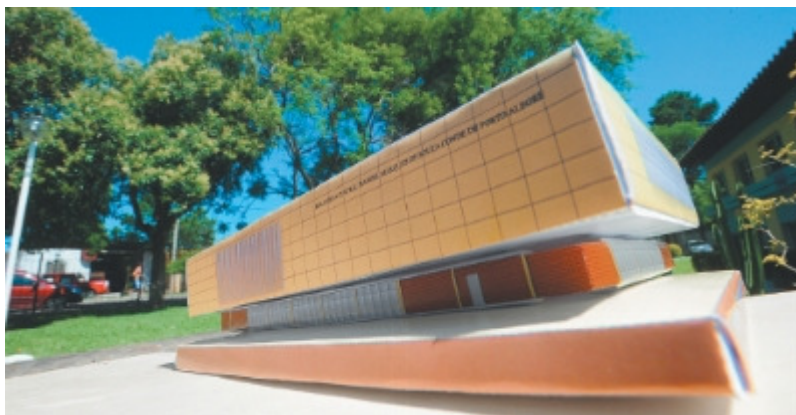
Figura 5 - A maquete da Biblioteca Central da UFSM

No projeto, foram produzidas maquetes em papel de prédios representativos do patrimônio histórico da cidade e, posteriormente, encartadas em um jornal de grande circulação, entre dezembro de 2010 e maio de 2011. A primeira maquete publicada foi uma réplica do prédio da Biblioteca Central visualizada na Figura 5, tendo por objetivo aproximar a população de Santa Maria do seu patrimônio, e também para marcar os 50 anos da instituição. 12