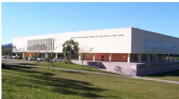
Figura 2 - Fachada da Biblioteca Central com o estacionamento à frente

Sua estrutura de concreto armado distribui-se numa área de 8.237m 2 (Figura 2) nos quais "A edificação é um volume puro de base retangular com pátio central, resolvida em três pavimentos, sendo um subsolo, o térreo, e o pavimento superior além do mezanino." (ZAMPIERI, 2011, p. 154)