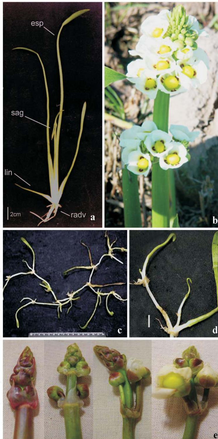
Figura 2 - Aspectos morfológicos de Sagittaria montevidensis . UFRGS/Porto Alegre-RS, 2002a). Planta com diferentes tipos foliares (série heteroblástica, escala = 2 cm); b) Inflorescência atípica, apresentando várias flores megasporangiadas; c) Desenvolvimento simpodial do estolão com morfologia juvenil; d) Porção terminal do estolão, apresentando diferenciação de raízes adventícia e folhas lineares nos nós (escala = 1 cm); e) Exemplo de antese sequencial em uma inflorescência (racemo). esp – folha espatulada, lin – folha linear, sag – folha sagitada, radv – raiz adventícia.