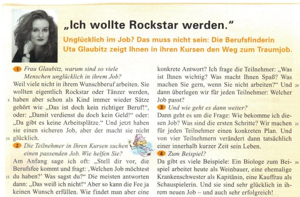
Figura 4: Exemplo de texto autêntico adaptado extraído do livro SchritteInternational3 A2/1 (HILPERT/ NIEBISCH/PENNING-HIEMSTRA, 2012: 64).

originalmente na revista Berliner Magaz in Zitty , e adaptada para o livro didático Schritte International . A entrevista foi bastante reduzida e sofreu modificações no layout , vocabulário e gramática.