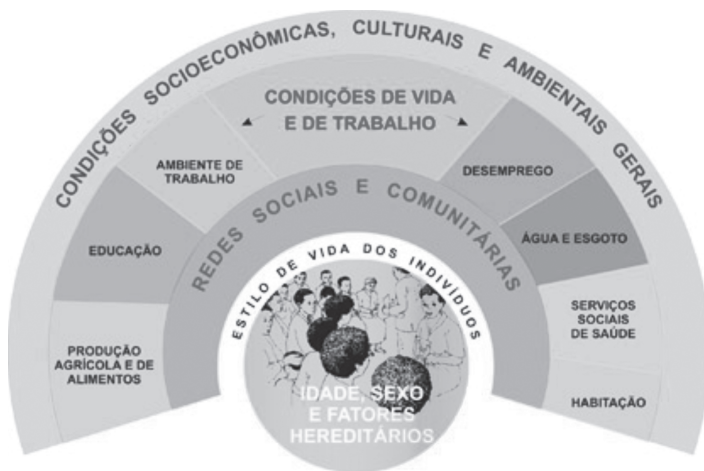
Figura 1 - Determinantes sociais: modelo de Dahlgren e Whitehead

A camada seguinte destaca a influência das redes comunitárias e de apoio, cuja maior ou menor riqueza expressa o nível de coesão social que, como vimos, é de fundamental importância para a saúde da sociedade como um todo. No próximo nível estão representados os fatores relacionados a condições de vida e de trabalho, disponibilidade de alimentos e acesso a ambientes e serviços essenciais, como saúde e educação, indicando que as pessoas em desvantagem social correm um risco diferenciado, criado por condições habitacionais mais humildes, exposição a condições mais perigosas ou estressantes de trabalho e acesso menor aos serviços. Finalmente, no último nível estão situados os macrodeterminantes relacionados às condições econômicas, culturais e ambientais da sociedade e que possuem grande influência sobre as demais camadas.