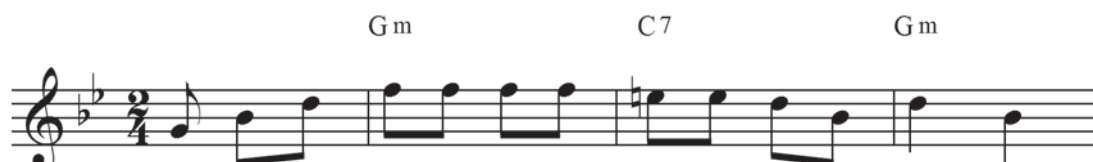
Ex.15 – Primeiras notas do terceiro verso de Baião da Garoa de Luís Gonzaga/Hervé Cordovil