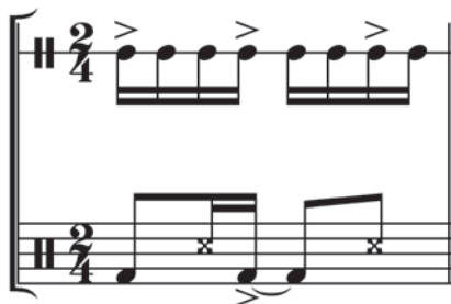
Ex.23 – Zabumba e sanfona – padrão 3+3+2 na "levada" da sanfona.

Vejamos agora outra opção de acentuação para as semicolcheias, tomando como base a "levada" da sanfona. No Ex.23, a pauta superior representa a sanfona e a pauta inferior mantém a condução mais elementar da zabumba.