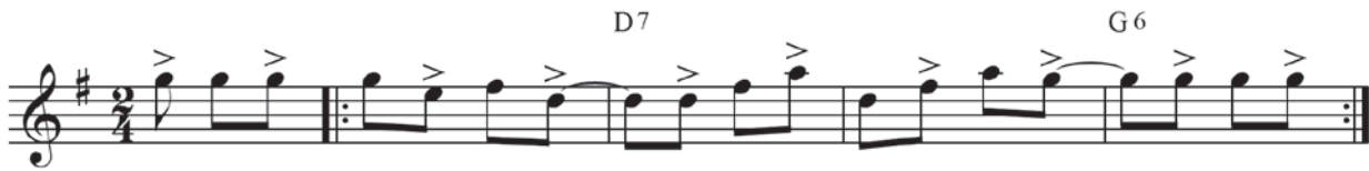
Ex.21 – Trecho final da gravação de 1950 de Dezessete légua e meia de Humberto Teixeira/Carlos Barroso.

que há uma leve acentuação nos contratempos. No final da música Dezessete légua e meia de Humberto Teixeira/Carlos Barroso, Gonzaga fica repetindo o trecho transcrito no Ex.21.