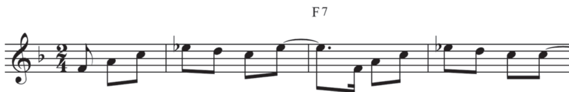
Ex.14 – Primeiras notas da "versão instrumental" de Baião de Luiz Gonzaga/Humberto Teixeira.