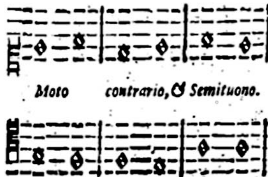
Figura 5: Il Transilvano (p.218) – Exemplo da preceptiva do Quarto movimento – contrário e semitom – entre consonâncias imperfeitas e perfeitas.

que se abre à oitava – Sol-Mi/Fá-Fá, e, Fá-Ré/Mi-Mi, respectivamente. No terceiro compasso, seguindo a preceptiva, vemos que a sexta menor se fecha – neste caso, em uma quinta: Lá-Fá/Lá-Mi,