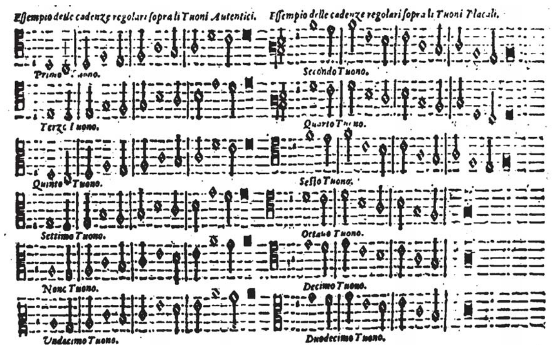
Figura 9: Il Transilvano (p.276) – Tabela sinótica das cordas (notas) cadenciais dos modos autênticos e plagais.

Na Figura 9 temos a demonstração que nosso autor faz das cordas (notas) cadenciais de cada tom, segundo a sua natureza autêntica ou plagal. Observe que Diruta não coloca os acidentes necessários para o artifício da cadência: é provável que pressuponha que tenha sido claro na preceptiva do semitom mi-fa nas cadências, conforme já vimos anteriormente. 8