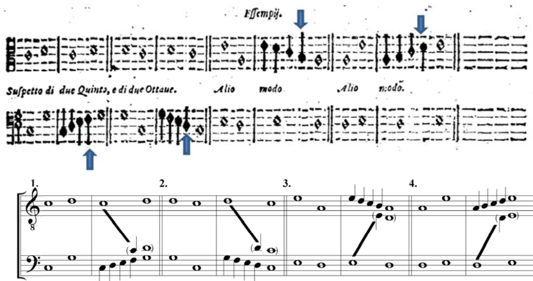
Figura 3: Il Transilvano (p.221) – Movimentos diretos entre consonâncias perfeitas que incorrem em quintas e oitavas paralelas ocultas (original e transcrição com notação moderna que com acréscimos e alterações para maior clareza).

No grupo de compassos número um da Figura 3, Diruta apresenta o movimento direto e ascendente entre uma oitava e uma quinta que resulta em uma quinta paralela oculta (Fá-Dó e Sol-Ré). A composição virtual dos intervalos musicais – coerente com a doutrina das espécies que vimos a pouco – é explicitada pelo autor através de semínimas que percorrem todo aquele âmbito e desvelam o paralelismo antes oculto. O segundo grupo de compassos descreve o movimento descendente entre uma quinta e uma oitava que ocasiona uma oitava paralela igualmente oculta (Ré-Ré e Dó-Dó). O terceiro e quarto grupos apresentam como resultado do movimento direto entre consonâncias perfeitas duas oitavas paralelas ocultas.