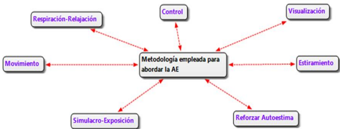
Figura 2 – Categoría B y sus Subcategorías

Recopilación de todas las técnicas, métodos y formas de abordar la clase para combatir contra la AE. Entre ellas, están la relajación diferencial de Jacobson, la visualización, los simulacros de audiciones, etc. Comentan que aplican estos recursos debido a su experiencia como docente y a lo que sus docentes les inculcaron cuando fueron estudiantes.