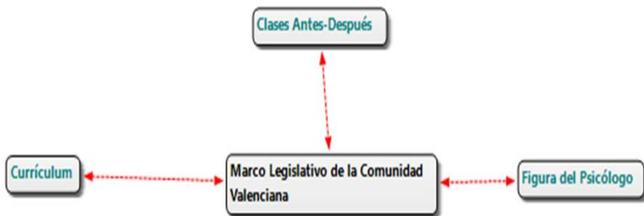
Figura 3 – Categoría C y sus Subcategorías