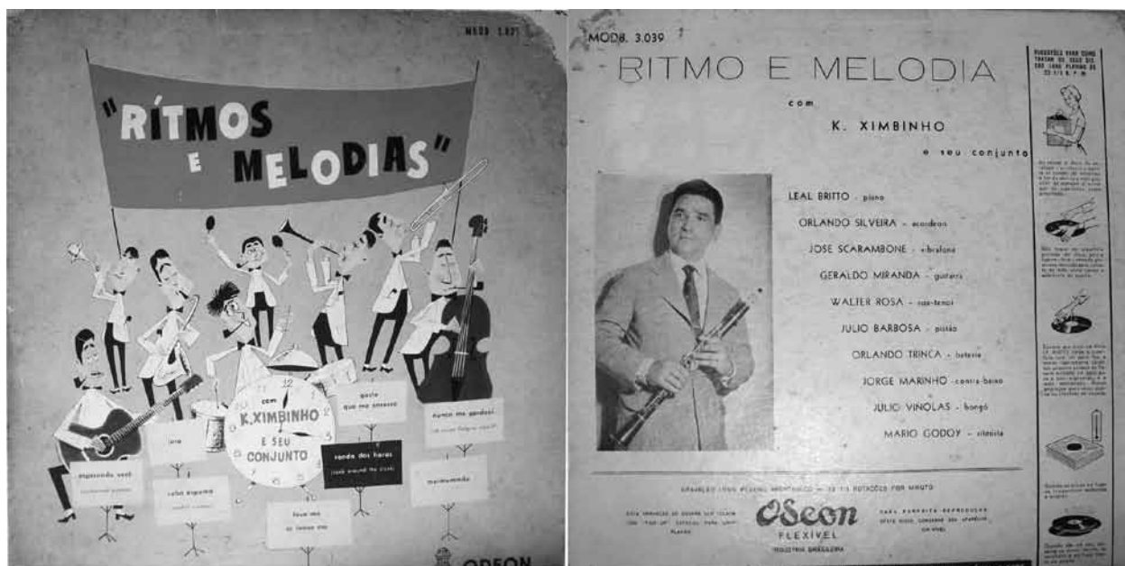
Ex.2 - Ritmos e Melodias , Odeon 1956. Capa e contra-capa.