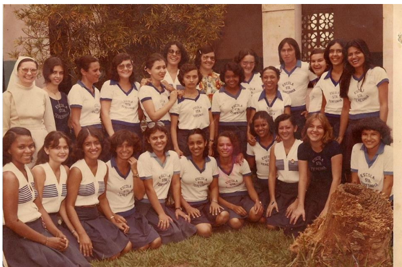
Figura 2: Última turma da Escola Normal – 1979