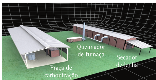
Figura 2. Desenho esquemático da UPC.

O PCCMV é de concepção simples, constituindo-se em um processo semicontínuo para produção de carvão vegetal. O processo de produção consiste basicamente em carregar o cilindro metálico com lenha previamente cortada em tamanho uniforme e com o teor de umidade reduzido. O cilindro metálico carregado é fechado na extremidade inferior com uma grelha que permite a circulação do ar e dos fumos decorrentes da carbonização da lenha. Assentado na posição vertical sobre um suporte na base do forno inicia-se a carbonização a partir da ignição da lenha. A fumaça oriunda da carbonização é canalizada para o queimador. Parte do ar quente, proveniente dessa queima, é transferida para a unidade de secagem da lenha que pode contar, opcionalmente, com o auxílio de um sistema de micro-ondas instalado nas paredes externas que emite radiação para a lenha em secagem, facilitando a evaporação. A cada ciclo de carbonização, o cilindro é colocado em resfriamento e então descarregado. Esta concepção constitui o Processo Teórico.