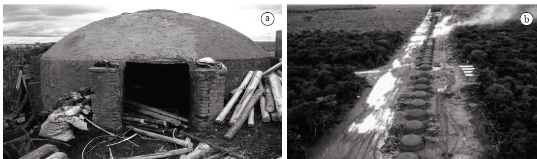
Figura 1. a) Forno “Rabo Quente”; e b) Bateria de fornos “Rabo Quente”.

Os dados referentes a este processo foram coletados numa unidade de produção de carvão vegetal (UPC) localizada no Estado do Paraná e que utiliza o processo de carbonização em cilindros metálicos verticais. Possui como característica principal a produção em escala industrial, à qual se agregam os aspectos técnicos, econômicos, ambientais e sociais como fatores diferenciais entre os processos utilizados atualmente, conforme mostra a Figura 2.