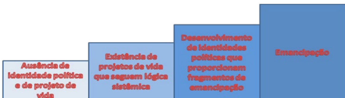
Figura 2. Diferentes estágios de desenvolvimento da identidade mediados pela existência de projeto de vida e da conquista de identidade política