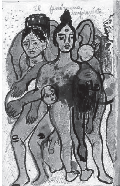
Figura 4. Lâmina 42: “O Fenômeno Imprevisto”, de aproximadamente 1954.

Além disso, se, por um lado, o primeiro passo do menino na fase fálica é a vinculação da masturbação às catexias objetivas e a entrada no Complexo de Édipo, por outro, a primeira reação da menina frente ao sexo oposto é a descoberta de sua deficiência, sua falta, e a conseqüente inveja do pênis: “Ela viu, sabe que não tem e quer tê-lo” (Freud, 1925a/1996, p. 281).