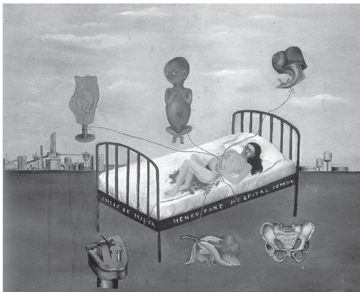
Figura 2. "O Hospital Henry Ford", de 1932 Óleo sobre metal, 30,5 x 38 cm.

dos na cadeira e colocados sobre a perna de Frida. Devido a essa dimensão que é dada aos cabelos na tela, podemos dizer que os cabelos são tomados como significantes provisórios da sexualidade feminina: "Agora que estás careca, já não te amo". Há, nessa tela, o remetimento à perda e essa perda gera sofrimento pela possibilidade de uma segunda perda, que é a perda de amor.