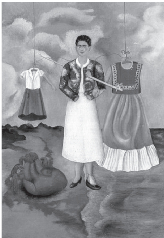
Figura 5. "Recordação", de 1937, Óleo sobre metal, 40 x 28 cm.

Assim, dentro de uma relação metonímica, a menina, na medida em que assume, no primeiro tempo do Édipo, o desejo da mãe – ser ou não ser o falo – e se inscreve no lugar da metonímia da mãe, transforma-se em asujeito . Enquanto isso, numa relação metafórica, dá-se o Complexo de Castração, no qual substituições terão que ser feitas. Entretanto, mesmo que o Complexo de Castração seja uma relação metafórica, o resultado dele na menina é metafórico e metonímico, na medida em que, assim como sua mãe, ela também viverá apenas parcialmente no mundo simbólico, enquanto que parte do seu desejo permanecerá no plano imaginário.