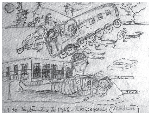
Figura 1. "O Acidente", de 1926, Lápis sobre papel 20 x 27 cm.