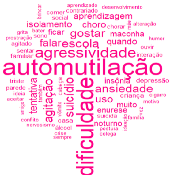
Figura 1. Nuvem de palavras referentes às queixas registradas no prontuário dos usuários do sexo feminino

Buscou-se identificar nos prontuários as principais queixas registradas pelos profissionais no(s) primeiro(s) acolhimento(s) das crianças e adolescentes. Com o intuito de visualizar possíveis diferenças entre sexos, gerou-se duas nuvens de palavras, uma para as principais queixas registradas às meninas (Figura 1) e uma para as principais queixas registradas aos meninos (Figura 2). Observou-se que na nuvem das meninas houve prevalência de “automutilação”, ao passo que na nuvem dos meninos a prevalência foi de “agressividade”. As queixas ligadas às dificuldades nos contextos escolares estão presentes de forma significativa em ambos os sexos.