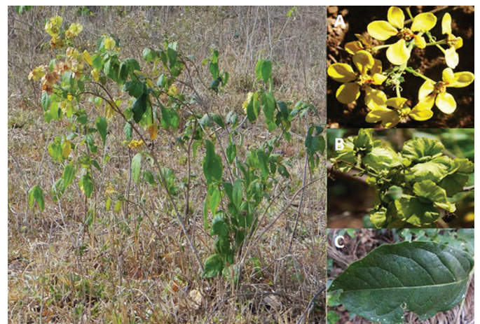
Fig.2. Arbusto de Niedenzuella stannea , agosto/2013. Torixoréu, MT. (A) Inflorescência. (B) Frutificação. (C) Folhas maduras fibrosas e com limbo verde-escuro.