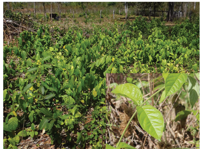
Fig.1. Niedenzuella stannea , julho/2014. Torixoréu, MT. Área de intensa brotação de N. stannea . Em detalhe, observam-se as folhas com limbo verde-claro.