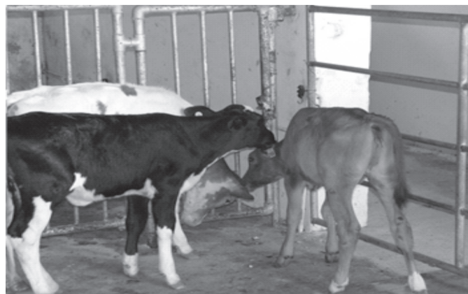
Fig.9. Três bezerras lactentes fazendo cross-sucking .

jam os principais fatores que desencadeiam o cross-sucking nos bezerros. Esse comportamento pode permanecer ativo mesmo após a desmama, quando os animais se sentem “frustrados” ao esperar o fornecimento de concentrados (Fig.10). O grande problema é que esse hábito pode resultar em danos ao úbere (Fig.11), mamite imediatamente ao primeiro parto e descarte antecipado dos animais que sofrem cross-sucking . Nos casos mais extremáticos alguns animais mamam em si mesmos e nos demais companheiros do rebanho (Fig.12).