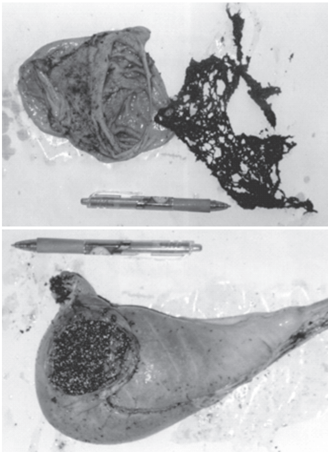
Fig.6. Plástico no abomaso de vitelos com 62 dias de vida.

Noutra ocasião, com o objetivo de testar a viabilidade da produção de vitelos caprinos da raça Saanen, um caprinocultor confinou alguns machos recém-nascidos e passou a alimentá-los exclusivamente com leite de vaca fornecido em quantidade crescente a cada semana. Decorridos cerca de 50-55 dias, houve uma previsão da meteorologia que uma frente fria passaria pela região e que a temperatura noturna poderia atingir 2-5°C. Mediante essa previsão, o proprietário resolveu por uma lona plástica preta na única lateral da baía que era feita de ripas de madeira espaçadas a cada 5 cm; após a fixação da lona, os animais praticamente a devoraram em poucos dias, sendo que vários morreram por obstrução abomasal, demonstrando claramente que essa perversão do apetite se deveu à imperativa necessidade de fibra pelos animais (Fig.6). (Malafaia, dados não publicados 2005)