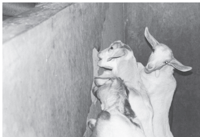
Fig.5. Caprinos jovens, não lactentes, roendo a parede da baia.