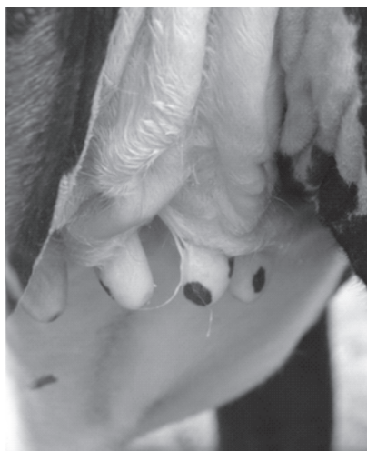
Fig.11. Úbere do animal que sofreu cross-sucking na Figura 10.