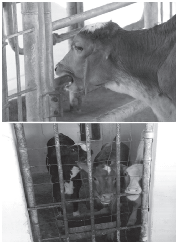
Fig.8. (A) Animal mordendo cano. (B) Duas bezerras mordendo cano e uma chupando a orelha de outra após receberem 2 litros de leite via balde.

sar pouco tempo depois do aleitamento. De Passilé et al. (1992) verificaram que é normal os bezerros, após o aleitamento artificial, realizarem as seguintes atividades: chuparem ou mastigarem objetos presentes nos abrigos, explorarem o interior do abrigo e, por fim, descansarem.