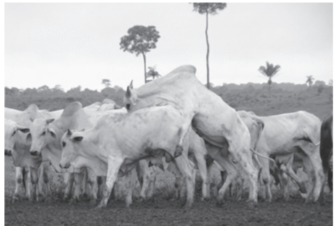
Fig.2. Animal criado em ambiente de pastagem e praticando sodomia.

lidade final da carcaça (Ítavo et al. 2008), alguns criadores têm optado por manter os animais não castrados nos confinamentos ou nas pastagens. Porém, lotes de animais inteiros pós-púberes, com grande variação de peso e submetidos à elevadas taxas de lotação, sobretudo em presença de outros fatores externos, como estresse térmico, espaço reduzido de sombra e excesso de lama, passam a exibir sodomia, que é um distúrbio comportamental que se caracteriza quando um animal é repetidamente montado por outro(s), maior(es) e mais forte(s), que acaba(m) por feri-lo ou até mesmo levá-lo a morte (Barbosa, comunicação pessoal 2010). A sodomia pode estar mais relacionada com o empobrecimento ambiental e com a degradação do bem-estar dos animais do que propriamente com o desejo sexual. Os animais dominantes, que saltam repetidamente sobre os outros, lesionam os cascos posteriores, pois a intensa pressão do peso sobre as unhas causa danos à microcirculação do casco, o que origina hematomas na sola, seguidos por ulcerações nas mesmas. Essas lesões podais interferem negativamente no consumo de alimentos, reduzem o ganho de peso, comprometem a saúde dos animais e geram despesas consideráveis com seu tratamento.