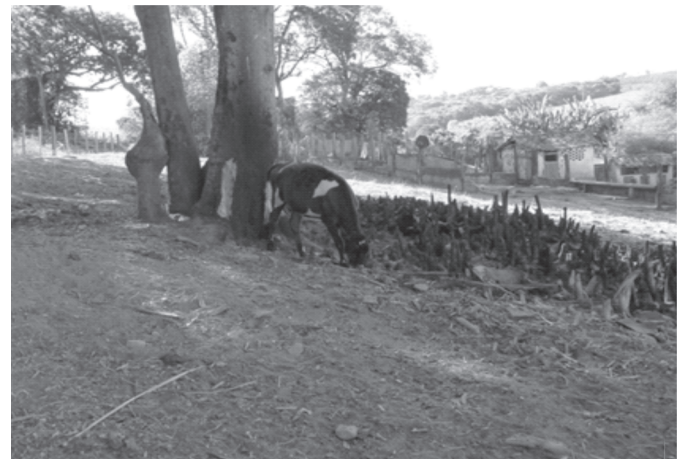
Fig.7. Árvore roída e pasto rapado.

Decorrentes do sistema de aleitamento. Um desvio comportamental frequentemente observado é o hábito de mastigar e/ou sugar madeira, trincos, cadeados ou canos de ferro (Fig.8a,b) utilizados para a construção dos abrigos onde os bezerros são criados, isoladamente ou não, em sistemas de aleitamento artificial e aleitados duas vezes por dia. Entretanto, é necessário identificar se esse hábito é persistente ao longo do dia, de forma repetitiva, regular ou invariável, o que caracterizaria uma estereotipia. Na maioria das vezes esse hábito é um comportamento não estereotipado resultante da rápida ingestão de um grande volume de leite (fornecido em baldes ou em mamadeiras cujo bico teve seu orifício alargado) e da visualização do tratador ainda fornecendo leite aos demais bezerros (Fig.8b). Neste caso, esse hábito tende a ces-