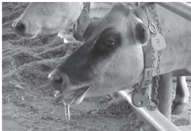
Fig.3. Estresse térmico em vacas criadas em sistema tiestall