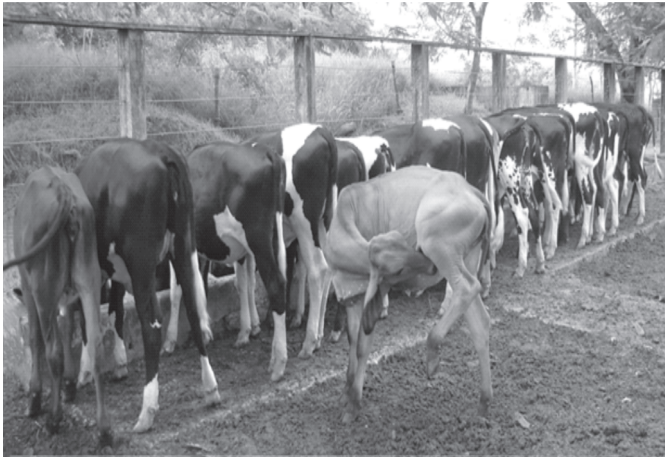
Fig.12. Enquanto todos os animais comem o concentrado a bezerro, habituada a fazer cross-sucking nas outras, começa a mamar em si própria.

As formas, ainda que empíricas, de minimizar o cross-sucking nos bezerros seria aleitá-los em separado (amarrá-los, distantes uns dos outros, no momento do aleitamento e, após mamarem, deixá-los 10 a 15 minutos presos), evitar ofertar o leite em baldes, dar preferência a sistemas que usem tetas artificiais cujo furo na ponta do bico possui diâmetro reduzido, fornecer um pouco de água (via qualquer sistema com teta artificial), lavar a boca após a ingestão do leite (isso remove o gosto do leite na boca dos animais) e retirar do grupo o animal que porventura apareça com essa alteração, pois especula-se que os animais aprendam, por imitação, a fazer o cross-sucking .