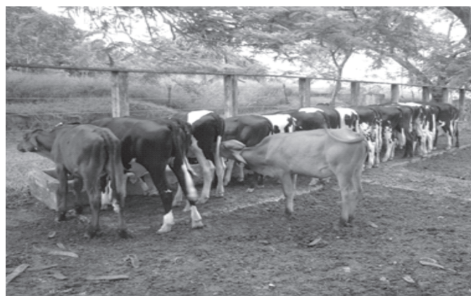
Fig.10. Bezerra desmamada mamando em outra enquanto o lote ingere o arraçoamento matinal.