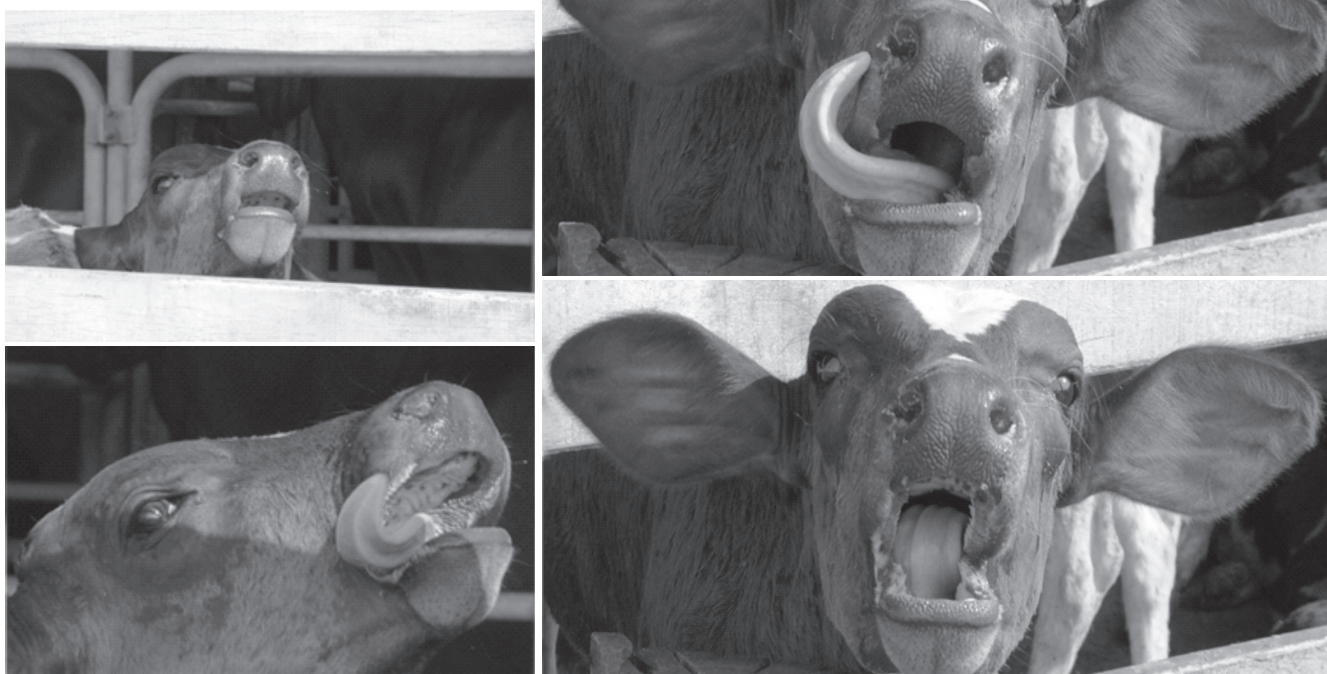
Fig.4. Sequência da estereotipia de “brincar com a língua” em um mesmo bezerro.

Sua origem, ainda que desconhecida, provavelmente deve-se a efeitos multifatoriais originados pelo empobrecimento ambiental, tais como o confinamento por longos períodos, ausência ( zero-grazing ) ou pouco tempo gasto pastando, excesso de alimentos finamente moídos e o aleitamento artificial mal feito. Os bovinos evoluíram, por milênios, vivendo em liberdade e utilizando sua língua para sentir e coletar alimentos fibrosos de grande tamanho (Van Soest 1994); dessa forma, a ausência ou o pouco tempo disponibilizado para pastar, a oferta constante da dieta e a ingestão de partículas finamente moídas reduzem as atividades de caminhar livremente, mastigar e ruminar sendo, portanto, motivos geradores de “frustação” nos animais. Já em bezerros lactentes, se grande quantidade de leite for ministrada em uma ou duas mamadas diárias e este for dado em baldes ou em mamadeiras cujo orifício do bico foi alargado com o objetivo de reduzir o tempo gasto para aleitar os animais, um grande volume de leite passará rapidamente pela boca, reduzindo a sensação de permanência desse alimento na cavidade oral e, portanto, esse manejo pode causar um sentimento de “frustação”, pois os mamíferos precisam de desenvolver o hábito de sucção quando lactentes.