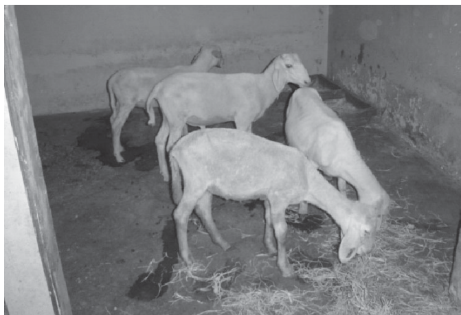
Fig.2. Cordeiros 1, 2, 3, e 6 apresentando queda total da lã após 23 dias do início da administração de Leucaena leucocephala .

mesma. Na terceira etapa, após 30 dias de intervalo, este animal não apresentou sinais clínicos da intoxicação. Os Cordeiros 2 e 3 do Tratamento IV apresentaram desprendimento de lã após 6 dias de administração da planta e queda total de lã após 20 dias (Fig.2) de consumo de L. leucocephala . Na segunda etapa, após 15 dias de intervalo, ambos apresentaram desprendimento de lã 9 dias após o reinício da administração da planta. O Cordeiro 2 apresentou queda total da lã após 17 dias do início da administração da planta e o Cordeiro 3 recuperou-se após a suspensão do fornecimento da planta. Na terceira etapa, após 30 dias de intervalo, ambos apresentaram discreto desprendimento de lã 6 dias após o início da administração da planta e recuperaram-se após a suspensão.