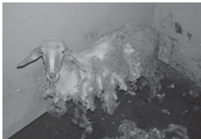
Fig.1. Cordeiro 1 (Tratamento III), apresentando desprendimento espontâneo da lã 6 dias após dieta total com Leucaena leucocephala .

O Cordeiro 1 do Tratamento III apresentou desprendimento de lã após 6 dias do início da administração da planta (Fig.1), e queda total da lã após 20 dias do início da administração (Fig.2). Na segunda etapa, após 15 dias de intervalo, este animal apresentou desprendimento de lã após 6 dias do reinício da administração da planta e queda total de lã após 12 dias de consumo da