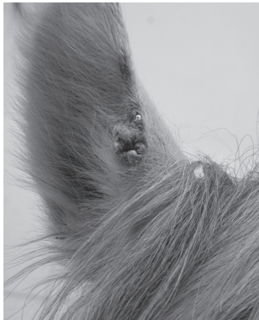
Fig.3. Sarcoide equino. Cabeça. Massa multilobulada, alopecica e de aspecto vegetativo no pavilhão auricular.

Equinos que apresentavam tumores nos membros totalizaram 22 dos 40 casos analisados.