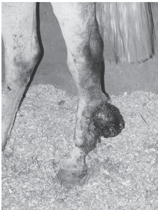
Fig.1. Sarcoide equino. Membro posterior. Massa ulcerada na região do calcâneo.

et al. 2002, Chambers et al. 2003, Lloyd et al. 2003). Neste estudo, em mais da metade dos casos (22/40[55,0%]), os sarcoides apresentavam distribuição multifocal. Desses, em 72,7% (16/22) havia tumor nos membros (Fig.1) e/ou no tronco (Fig.2) e em 12 casos (54,5%) havia tumor na cabeça (Fig.3). No restante dos casos (18/40), observaram-se sete (17,5%) apenas na cabeça, sete (17,5%) somente nos membros e quatro (10,0%) apenas no tronco.