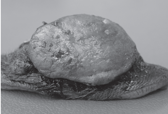
Fig.4. Sarcoide equino. Massa fibroblástica, difusamente ulcerada e com aparência carnosa.