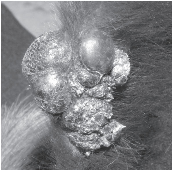
Fig.5. Sarcoide equino. Massa mista, constituída de componentes fibroblástico e verrucoso.

Acredita-se que a alta prevalência de sarcoides fibroblásticos e mistos observada neste estudo se deva ao fato que, com o tempo, as lesões podem mudar de padrão morfológico. Por exemplo, é descrito que os sarcoides verrucosos e ocultos, quando traumatizados, podem transformar-se no tipo fibroblástico (Genetzky et al. 1983, Lloyd et al. 2003). Esses mesmos autores relatam também que sarcoides mistos são uma transição de verrucoso para o fibroblástico. Outra hipótese é que esta baixa prevalência da forma verrucosa pode ter relação com a região geográfica estudada. Sarcoides ocultos e verrucosos são incomuns na África e na Austrália, região situada na zona tropical sul, mas são particularmente comuns no Reino Unido, região subtropical norte (Scott & Miller Jr. 2003).