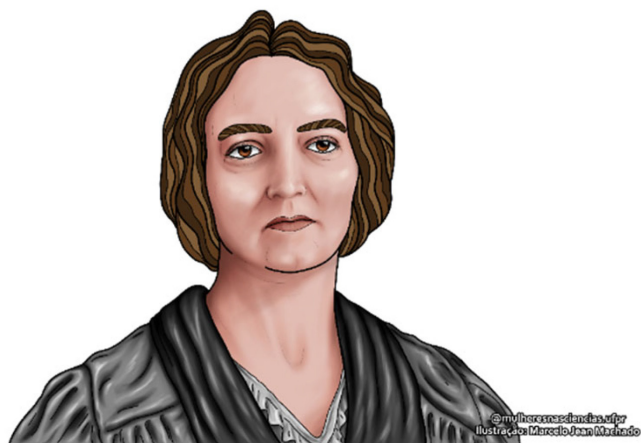
Figura 4. Ilustração de Irène Joliot-Curie

A francesa Irène Joliot-Curie, ilustrada na Figura 4, foi a 34ª pessoa a ganhar o Nobel de Química. O prêmio foi pela “sua síntese de novos elementos radioativos”.