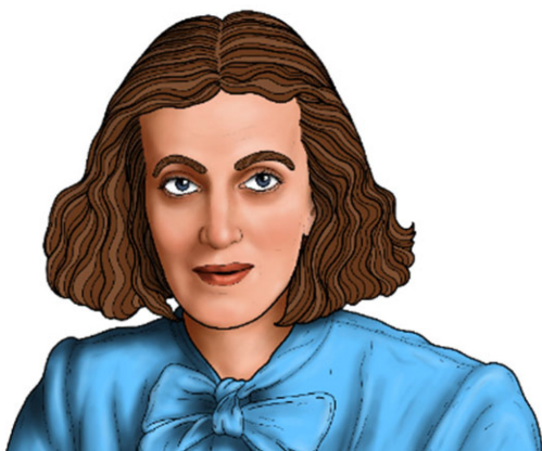
Figura 5. Ilustração de Dorothy Crowfoot Hodgkin