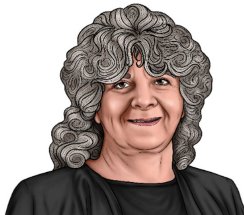
Figura 6. Ilustração de Ada Yonath

A israelense Ada Yonath, ilustrada na Figura 6, foi a 157ª pessoa a ganhar o Nobel de Química. O prêmio “por seus estudos sobre a estrutura e função dos ribossomos”.