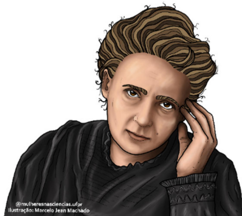
Figura 3. Ilustração de Marie Curie

A polonesa Marie Curie, ilustrada na Figura 3, foi a 11ª pessoa a ganhar o Nobel de Química. O prêmio foi concedido “em reconhecimento de seus serviços para o avanço da química, pela descoberta dos elementos rádio e polônio, pelo isolamento do rádio e pelo estudo da natureza e dos compostos deste notável elemento”. 12