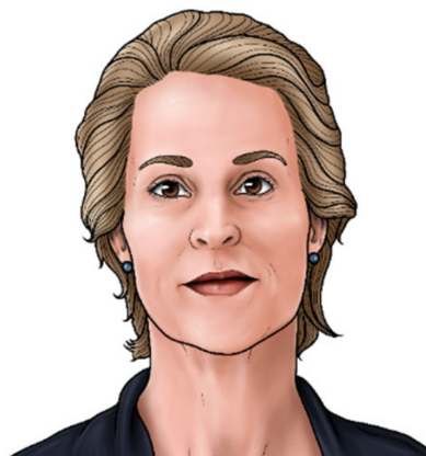
Figura 7. Ilustração de Frances Hamilton Arnold

A estadunidense Frances Hamilton Arnold, ilustrada na Figura 7, foi a 179ª pessoa a ganhar o Nobel de Química. O prêmio “pela evolução dirigida de enzimas”.