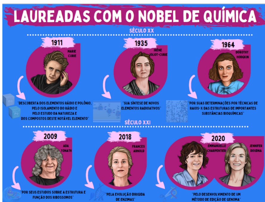
Figura 2. Laureadas e suas contribuições científicas para a premiação com o Nobel de Química

A seguir, apresentamos as contribuições científicas das laureadas em Química, em ordem cronológica da premiação, destacando seus nomes, data da conquista e o país em que atuavam profissionalmente quando receberam a honraria. Além disso, elencamos breves aspectos de suas biografias que auxiliam na elucidação do (re)conhecimento sobre elas.