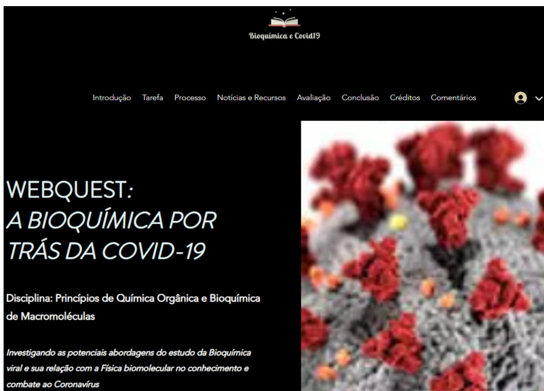
Figura 1. Tela inicial da WebQuest aplicada em aula sobre Bioquímica e COVID-19

Notícias e recursos: aba que disponibiliza notícias e recursos no formato de vídeos. O primeiro recurso, intitulado Coronavírus: O que COVID-19 faz com o seu Corpo , é uma videoreportagem de 5 minutos e 25 segundos feita pela British Broadcasting Corporation (BBC) sobre o processo de infecção da doença. O segundo recurso, intitulado O que é um Vírus? é uma videoreportagem de 6 minutos e 6 segundos elaborada pelo Jornal O Globo, cujo conteúdo aborda a natureza viral da doença COVID-19. A terceira videoreportagem, produzida pela Uol e com duração de 4 minutos e 43 segundos, é denominada O que Sabemos sobre as Vacinas Contra o Coronavírus? , e clarifica as etapas de produção dos imunizantes. O quarto recurso, intitulado Porque o Sabão Mata o Coronavírus??? (sic), diz respeito a uma videoaula de curta duração (1 minuto e 56 segundos), preparada