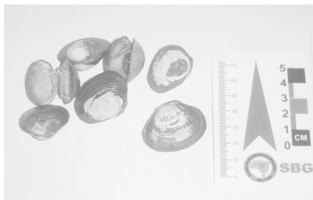
Figura 1. Bioindicador da espécie Corbicula fluminea

A presente investigação foi desenvolvida na Bacia Hidrográfica do Rio Ribeira de Iguape, em decorrência do histórico de contaminação deste rio por atividades de mineração. Nesse rio foram coletados moluscos classificados como pertencentes ao filo Mollusca, classe Bivalvia, ordem Veneroida, família Corbiculidae e espécie Corbicula fluminea (Figura 1). A amostragem desses bivalves teve por finalidade a aplicação da técnica de espectrometria de emissão óptica na detecção de elementos potencialmente tóxicos (metais pesados), especificamente Pb, Cu, Cr, Zn e Cd, para avaliação da biodisponibilidade destes elementos nesse ambiente.