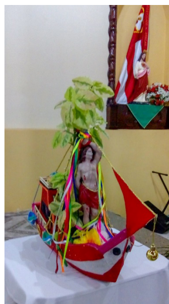
Figura 1 São Sebastião trazido pela procissão.