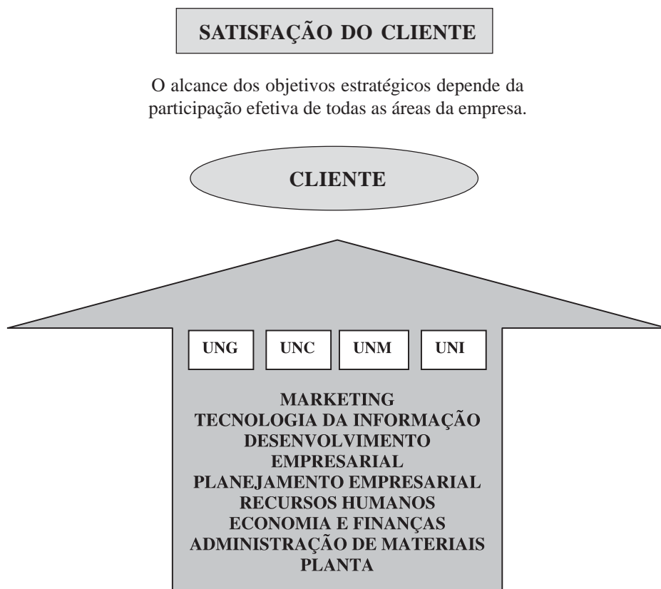
Figura 1: A Satisfação do Cliente e os Novos ‘Poderes’ na Telemig