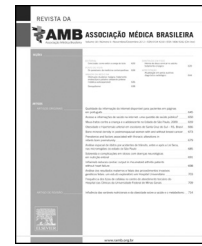
Imagem em Medicina