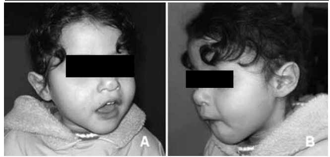
Figura 1 - Aparência craniofacial, frente (A) e perfil (B), de um dos pacientes com microdeleção 22q11.2

metafásicas com alto sinal de fundo, incompletas, ou muito próximas entre si, foram excluídos da análise. Os resultados foram interpretados de acordo com as normas presentes no International System for Human Cytogenetic Nomenclature (ISCN) 2005 15 .