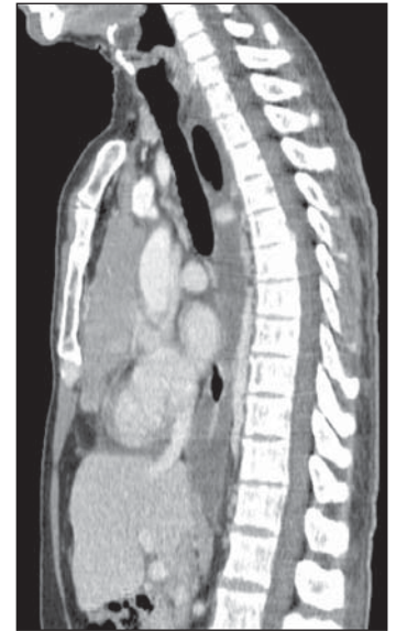
Figura 3. TC de tórax, janela de mediastino, corte sagital com contraste.