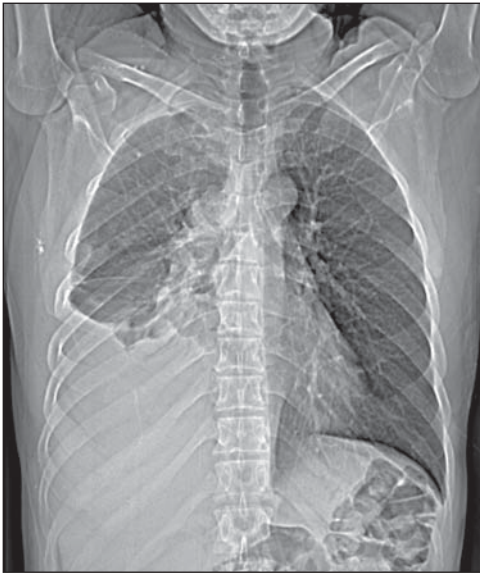
Figura 1. Radiografia digital de tórax.

Paciente do sexo masculino, 41 anos de idade, procedente de Goiânia, GO, com queixa de dor no hemitórax direito, ventilatório-dependente, há 40 dias. Relatava também dispneia aos moderados esforços e tosse seca ocasional. Ao exame físico notava-se expansibilidade torácica diminuída e murmúrio vesicular abolido na base pulmonar direita. O paciente foi encaminhado ao Serviço de Radiologia e Diagnóstico por Imagem, onde foram realizados exames de radiografia e tomografia computadorizada (TC) de tórax.