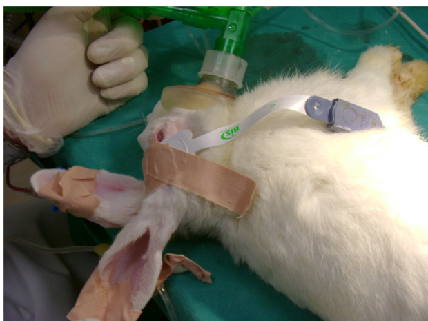
Figura 2 Aplicação da máscara da mistura de gás e sonda do BIS.

Os coelhos foram aleatoriamente distribuídos em dois grupos de sete cada. No Grupo S, a anestesia foi induzida com sevoflurano a 7-8% via inalação e o Grupo P recebeu infusão de 1-2 \text{ mg} \cdot \text{kg}^{-1} \cdot \text{min}^{-1} de propofol (figs. 1-2). Um nível adequado de indução foi determinado pelo desaparecimento de movimentos oculares e do reflexo da córnea, além de manter o BIS < 60\% . A anestesia foi mantida por meio da inalação de sevoflurano a 2,5-4% no Grupo S e por meio da infusão de propofol ( 1-2 \text{ mg} \cdot \text{kg}^{-1} \cdot \text{min}^{-1} ) no Grupo P. Uma mistura de gás foi administrada via máscara facial com a uma taxa de fluxo de 4 \text{ L} \cdot \text{min}^{-1} (Dameca, Dinamarca). A respiração espontânea foi mantida para atingir uma saturação de \text{O}_2 de \geq 95\% . Ambos os grupos foram completamente contidos por bandagem elástica a partir da extremidade direita e um torniquete foi colocado com