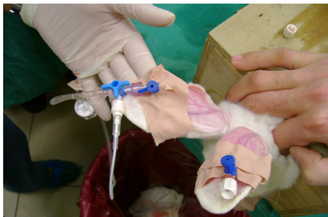
Figura 1 Infusão de propofol, cateterismo intravenoso e intra-arterial.

BSM-5135K, Japão) e índice bispectral (BIS) (Bispectral Index Monitor Model 2000, Aspect Medical Systems, Inc., Newton, MA, EUA) foram registrados em intervalos de 15 minutos (min) durante o procedimento. Após a depilação, sondas pediátricas foram usadas para monitorar o BIS (Aspect Medical Systems, Inc., Norwood, EUA). Durante o estudo, o BIS foi mantido a 50 \pm 10\% e 5 \text{ mL} \cdot \text{kg}^{-1} \cdot \text{h}^{-1} de solução salina isotônica foram infundidos durante o procedimento.