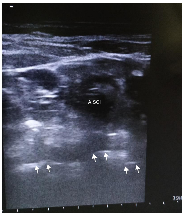
Figura 1 Imagem da região supraclavicular do paciente relatado. Nota-se que não é possível identificar com segurança os componentes do plexo braquial. ASCL, Artéria Subclávia; Setas, Pleura.

fáscia que recobre os três fascículos. A agulha foi posicionada entre os fascículos lateral e posterior e, nessa localização, foram injetados 20 mL de ropivacaína 0,75% e 20 mL de lidocaína com vasoconstritor 1,5%, para que houvesse diminuição da latência, além de analgesia duradoura, já que a cirurgia poderia ter duração prolongada. 6