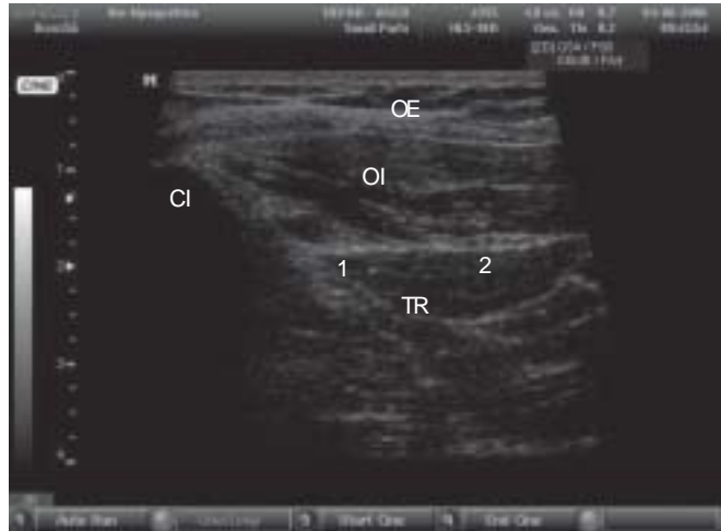
Figura 2 – Imagem Ultra-sonográfica Obtida com o Transdutor Posicionado. CI = crista ilíaca; OE = músculo oblíquo externo; OI = músculo oblíquo interno; TR = músculo transversal do abdome; 1 = nervo ilioinguinal; 2 = nervo iliohipogástrico.

A anestesia cirúrgica foi realizada com infusão-alvo controlada de propofol (Diprifusor – Astra Zeneca) e alfentanil 20 µg.kg -1 . Para a manutenção da via aérea foi utilizada máscara