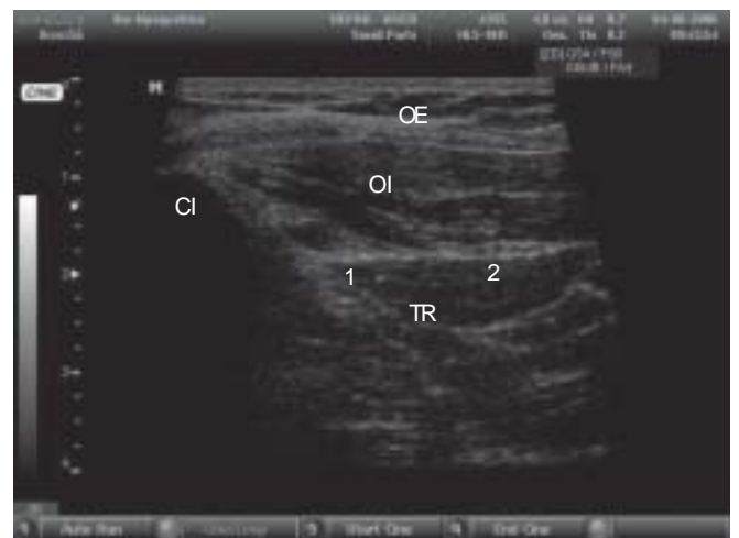
Figure 2 – Ultrasound Image Obtained when the Transducer is Positioned. CI = iliac crest; OE = externa oblique muscle; OI = internal oblique muscle; TR = transverse abdominis muscle; 1 = ilioinguinal nerve; 2 = iliohypogastric nerve.