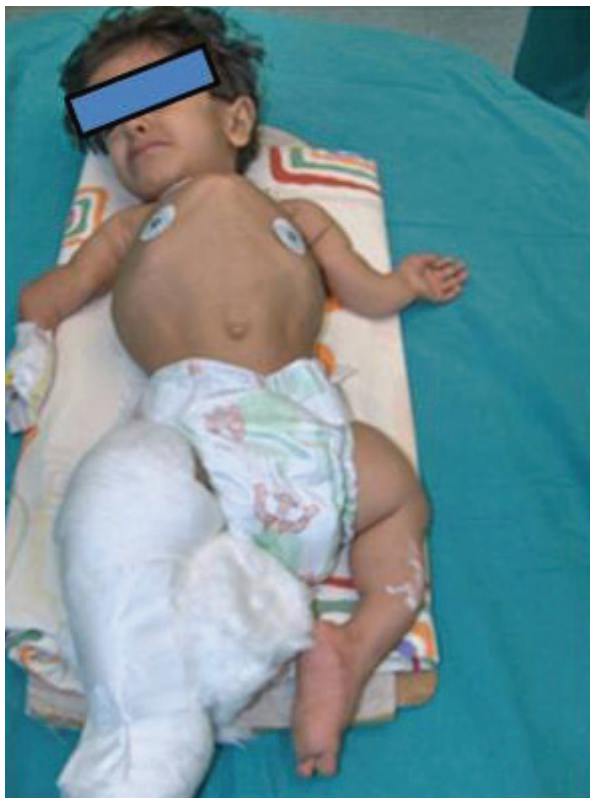
Figura 1 - Fotografía del niño con osteogénesis imperfecta antes del monitoreo.

La paciente fue derivada sin medicación preanestésica al quirófano, donde hicimos el electrocardiograma, oximetría de pulso, presión arterial no invasiva y monitoreo de la temperatura rectal. Los registros fueron los siguientes: SpO 2 , 96%; frecuencia cardíaca, 132 lpm; presión arterial no invasiva, 90/57 mmHg y temperatura rectal, 36.8°C. Después de 5 minutos de preoxigenación, la anestesia se indujo con propofol (2,5 mg.kg -1 ) y remifentanilo (1 µg.kg -1 ); el anestesista insertó una MLP n° 1,5 mientras cogía cuidadosamente la cabeza de la paciente y la ponía en posición neutra para no dañar los dientes del maxilar inferior. Después de la aspiración gástrica a través del tubo de drenaje de la MLP con una sonda nasogástrica, otra sonda esofágica se fijó para medir la temperatura del esófago que coincidía con la temperatura rectal. La anestesia se mantuvo con infusión de propofol (4