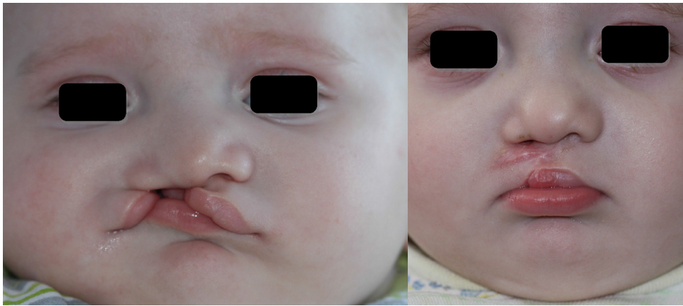
Figura 2 Fotografias do paciente no pré- e pós-operatório.

vias aéreas devido à dessaturação e cianose relacionadas ao fechamento da fenda até que consigam mudar seus hábitos respiratórios no período pós-operatório imediato. O fechamento da fenda pode ser problemático e um período de transição pode ser necessário para aliviar a agitação e os sintomas, semelhantes aos observados durante o período pós-operatório em pacientes submetidos a operações de septo nasal ou rinoplastia. Portanto, um período relativamente longo de uso das vias aéreas pode ser necessário até que esses pacientes aprendam a respirar através de suas “novas” vias aéreas.