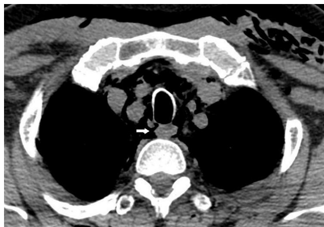
Figura 1 Ruptura de cisto paratraqueal.

Paciente do sexo masculino, 55 anos, estado físico ASA II, submetido à microcirurgia transoral eletiva a laser para o tratamento de edema de Reincke. O paciente não tinha o diagnóstico de doença pulmonar além de tabagismo crônico; sem sinais de intubação difícil.