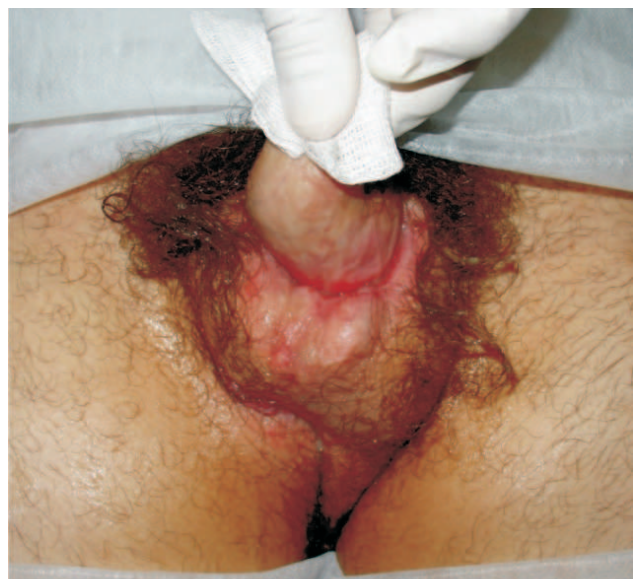
Figura 1c - Úlcera na base do pênis.