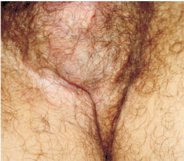
Figura 2a - Cicatriz na base da bolsa escrotal.