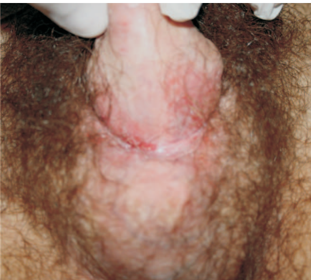
Figura 2b - Base do pênis, após seis meses de infliximabe.

e síndrome de Sweet. O terceiro tipo, mais raro, a DCM, consiste em lesões cutâneas granulomatosas sem contiguidade com o trato gastrointestinal. (2-5,8,12,14-16)