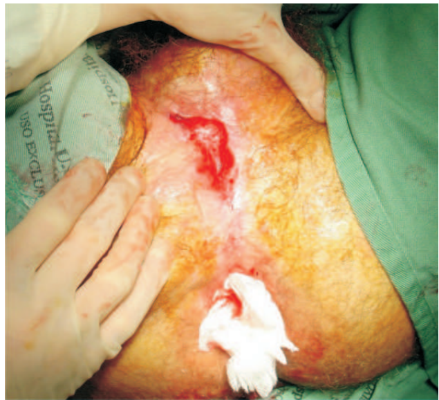
Figura 1b - Úlcera na base do escroto.