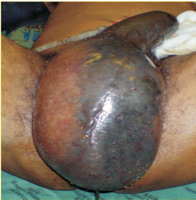
Figura 1 – Necrose do pênis e escroto.

O estudo histopatológico e imunohistoquímico da lesão retal confirmaram infiltração por adenocarcinoma de próstata, sendo positiva para PSA, positiva focal para CK20 e negativa para CK7 (figura 3). O paciente apresentou boa evolução pós-operatória e recebeu alta hospitalar no vigésimo dia de internação. Após três meses de seguimento ambulatorial a área operada encontrava-se cicatrizada (figura 4).