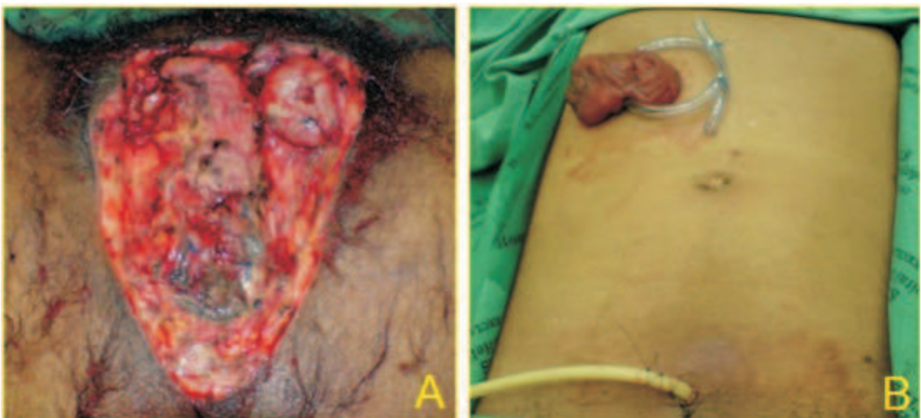
Figura 2 – A: Aspecto final da orquiectomia bilateral com penectomia total; B: Transversostomia e cistostomia.

O tratamento consiste em suporte hemodinâmico, antibioticoterapia de amplo espectro, desbridamento dos tecidos desvitalizados, oxigenioterapia hiperbárica, investigação do foco primário e, quando necessária, derivação urinária ou fecal. São indicações de cistostomia a estenose uretral ou fonte genitourinária da infecção, enquanto que a colostomia derivativa está indicada na infecção do esfíncter anal ou na presença de grande