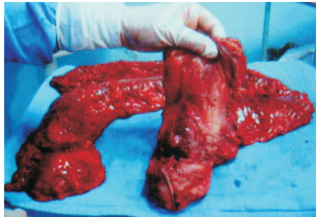
Figura 2 – Espécime cirúrgico constituído por reto, próstata, vesículas seminais, bexiga e todo o cólon remanescente.

Segundo dados do Instituto Nacional do Câncer (INCA), a estimativa de incidência de câncer colorretal no Brasil para 2008 é de 27.000 novos casos 23 . Considerando-se que 20% desses casos de CCR (5.400) correspondam à sua forma hereditária e que 30% destes sejam de HNPCC, teremos 1.620 portadores diagnosticados este ano. Diante desses dados, fica claro que a presente síndrome é subdiagnosticada no nosso país, pois não é incomum encontrar pacientes apresentando critérios evidentes para o diagnóstico de HNPCC e que tiveram apenas o tratamento para o câncer colorretal, não se investigando a possibilidade da doença nos familiares. As causas desse cenário estão, em grande parte, relacionadas à falta de conhecimento do profissional a respeito dessa entidade, uma vez que o simples questionamento da história familiar é