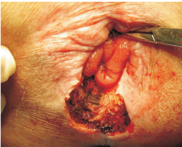
Figura 5 - Pós-resscação da lesão.