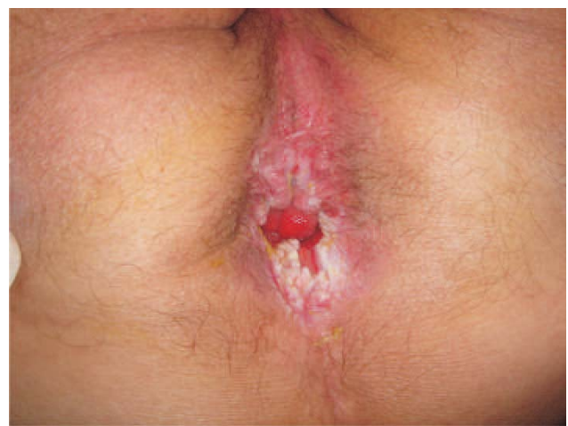
Figura 2 - Lesão residual após tratamento com Imiquimod.

O condiloma acuminado da região anogenital é causado pelo Papilomavírus humano (HPV), e os tipos 6, 11, 16 e 18 são os principais responsáveis. (7) Foi considerada a doença sexualmente transmissível mais diagnosticada em nosso meio. Sua incidência vem aumentando, associada a estados de imunossupressão, particularmente à AIDS. (8) Nestes pacientes, costuma