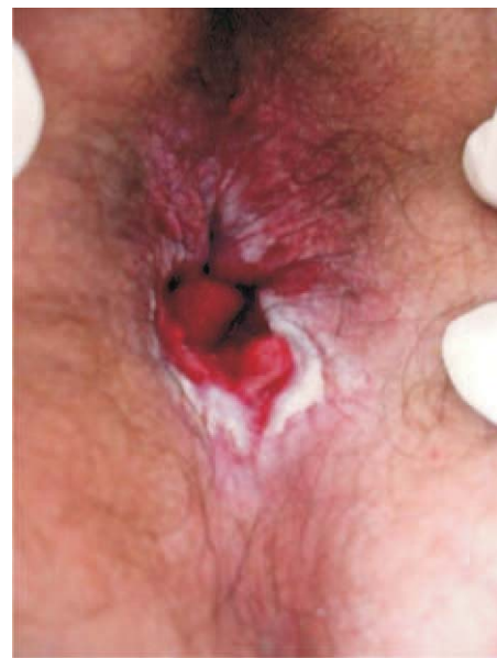
Figura 6 - Resultado final.

ser mais agressivo, com crescimento rápido, alto índice de recidiva e pouca resposta à terapia convencional. (9)