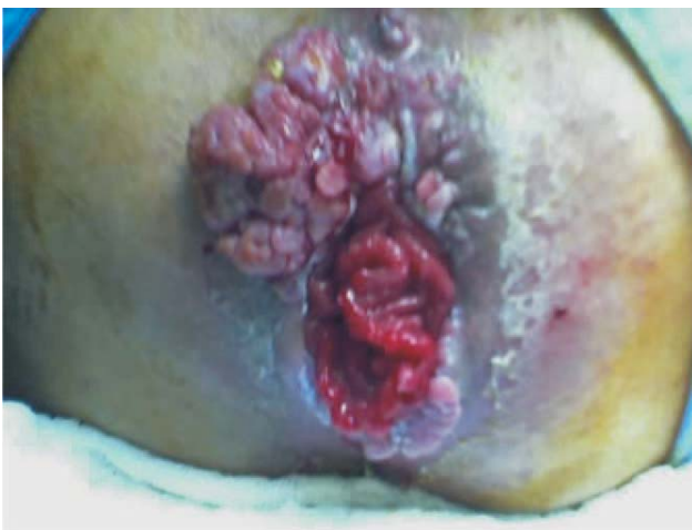
Figura 1 - Lesão vegetante e verrucosa em região perianal prévia ao tratamento.

Na investigação diagnóstica do paciente, foi realizado ultra-som endoanal com aparelho bidimensional. Este exame evidenciou imagem hiperecogênica envolvendo o esfíncter interno do ânus e ultrapassando seus limites, com acometimento da musculatura estriada (esfíncter externo do ânus), principalmente ao nível do canal anal inferior.