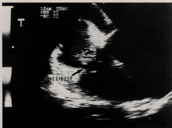
Fig. 1 - Ecocardiograma bidimensional mostrando corte apical. Quatro câmaras demonstrando a vegetação em valva tricúspide.

ficiência cardíaca congestiva de classe funcional IV (NYHA), insuficiência renal aguda franca (IRA) em diálise peritoneal intermitente.