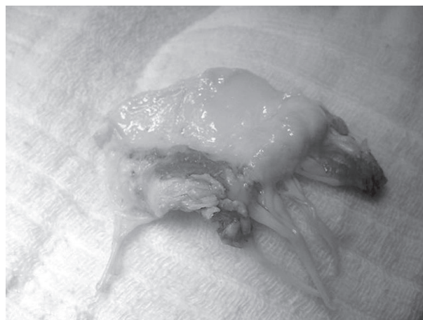
Fig. 1 - Cúspide anterior da valva mitral com vegetações.

No dia 17/01/2003, foi realizada a cirurgia, utilizando-se como via de acesso a esternotomia mediana, circulação extracorpórea e hipotermia moderada. Canularam-se a aorta ascendente e ambas as veias cavas, realizando-se a proteção