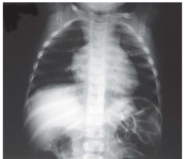
Fig. 1 – Radiografia de tórax com aumento de área cardíaca à custa de átrio direito

Ritmo sinusal, frequência de 150 bpm. SÂP +60°, intervalo PR 0,16 s, QTc 0,32s, QRS 0,08s, com eixo indeterminado. Sinais de sobrecarga ventricular direita.