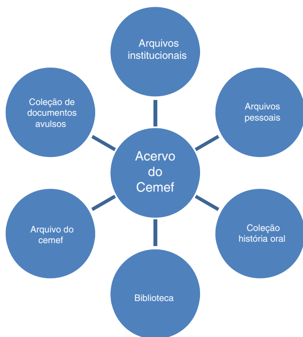
Figura 1 Linha de acervo