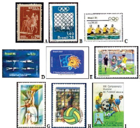
Figura 4: Algumas estampas postais pertencentes aos subeixos tem ticos "Esporte coletivo sem intera o" (A – E) e "Esporte coletivo com intera o" (F – I).

Por ocasião do II Campeonato Mundial de Nataç o em Piscina Curta, disputado no Rio de Janeiro/RJ, em 1995, foi lan ada a quadra contendo os nados: livre, costas, borboleta e peito. O selo evidenciando o nado livre est  reproduzido na Figura 4D. Nos XV Jogos Pan-americanos do Rio de Janeiro/RJ, ocorridos em 2007, o Polo Aqu tico foi lembrado com o selo destacado na Figura 4E, onde aparece Cau , mascote dos jogos.