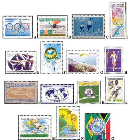
Figura 5: Seleção de alguns selos postais de diferentes subeixos temáticos, emitidos pela ECT.

Como salientado antes, a temática Futebol proporcionou muitos selos postais ao longo desses mais de 60 anos de filatelia esportiva brasileira. É o subeixo temático com maior amostragem, com 83 selos, cobrindo diferentes aspectos, como Personalidades, Estádios, Agremiações, dentre outros. Na Figura 5I está reproduzido o primeiro selo postal com motivo esportivo. Lançado em 24/06/1950, por ocasião do 4º Campeonato Mundial de Futebol, ilustra o então recém-inaugurado Estádio Mário Filho, mais conhecido como Maracanã.