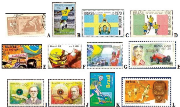
Figura 2: Exemplo de selos postais de pessoas que se destacaram no subeixo temático "Personalidades" e foram homenageadas nas emissões realizadas pela ECT.

Por ocasião dos XXV Jogos Olímpicos de Barcelona (1992), a ECT homenageou os atletas pioneiros do tiro ao alvo, Afrânio Costa (Figura 2I) e Guilherme Paraense (Figura 2J), ambos competindo nas VII Jogos Olímpicos da Antuérpia (1920), quando conquistaram a medalha de prata e de ouro, respectivamente.