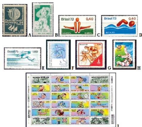
Figura 3: Reproduções de alguns selos postais comemorativos que pertencem aos subeixos temáticos “Esporte individual sem interação” (A - G) e “Esporte individual com interação” (H e I).

Foram computados 20 selos no subeixo temático Esporte individual sem interação . O latismo foi homenageado com a estampa da Figura 3A, emitida em 22/10/1959, devido ao Campeonato Mundial de Vela, classe Snipe, ocorrido em Porto Alegre/RS. O Alpinismo foi lembrado com o selo reproduzido na Figura 3B, em alusão aos 50 anos da primeira escalada ao pico “Dedo de Deus”, localizado entre Magé/RJ e Nova Friburgo/RJ).