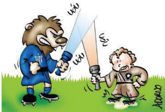
Figura 6. Charge de Adorno.

Adorno também faz a charge pré-jogo, intertextualizando com o filme Star Wars ( Guerra nas Estrelas ), trilogia de sucesso na década de 80, que já sofreu remaking nos anos 2000. As lanternas de ambos condensaram-se metafórica e iconicamente em espadas de Jedi. Cada personagem, com seu manto-roupão apropriado ao contexto intergaláctico, lutava, não para derrubar a lanterna um do outro, mas para perder a sua própria.