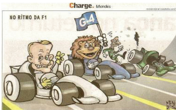
Figura 11. Charge de Mendes.