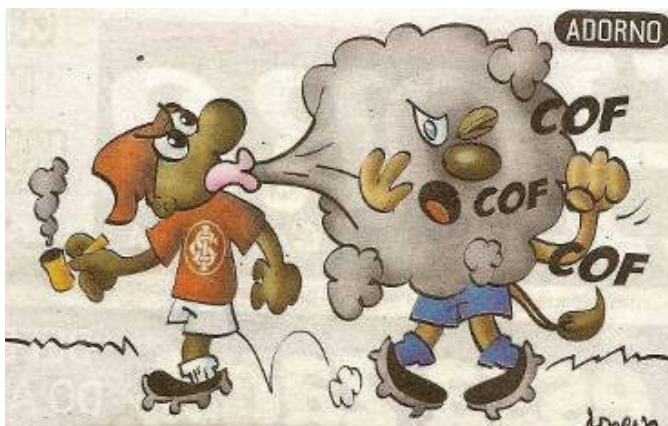
Figura 2. Charge de Adorno.

Leão vêm mais carregadas de componentes retóricos, em forma de figuras como metáfora e hipérbole, explicitando a crítica ideológica.