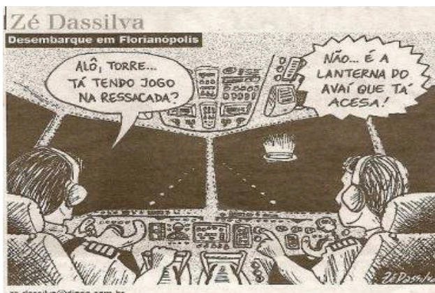
Figura 3. Charge de Zé Dassilva.

A lanterna do Avaí, no traço de Zé Dassilva, confunde-se com a luminosidade do estádio num processo analógico hiberbolizado. A voz do funcionário da torre de comando omite ser aquela luz apenas indicativa da luminosidade do estádio num jogo noturno. O chargista não escolhe o contexto do avião e do aeroporto por acaso, arbitrariamente. Aproveita-se de duas unidades culturais - aeroporto Hercílio Luz e estádio da Ressacada – porque estas estão presentes no mesmo sistema significativo que compõe o bairro onde estão situados (Carianos), ou seja, realmente o piloto de um avião, ao pousar no Aeroporto de Florianópolis, enxergará com destaque a luminosidade do estádio.