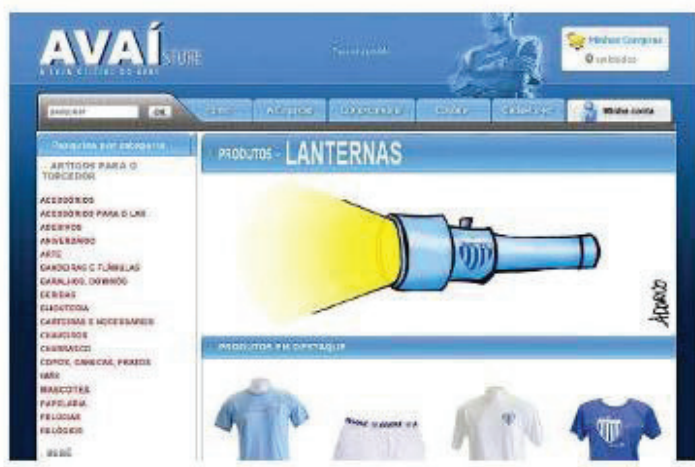
Figura 4. Charge de Adorno.

Desta vez, Adorno é quem coisifica a lanterna, colocando-a no contexto da página de vendas de artigos e produtos do clube, na store virtual do Avaí. Dá destaque ao produto da semana: a lanterna; zomba com a possibilidade do produto ser vendido no site oficial do clube.