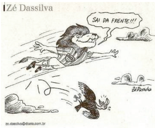
Figura 10. Charge de Zé Dasselva.