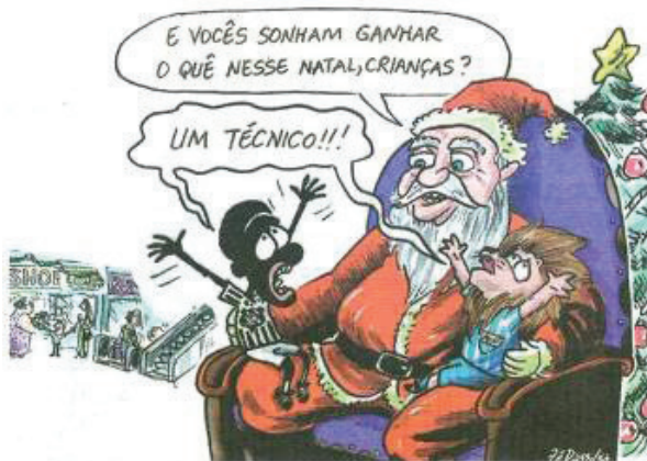
Figura 14. Charge de Zé Dasilva.

Fonte: Jornal: "Diário Catarinense" (DC), 03 dez. 2009.