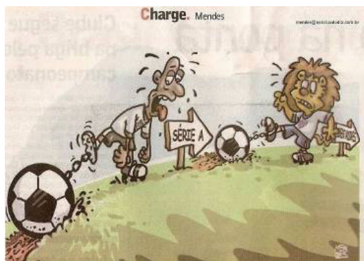
Figura 13. Charge de Mendes.

Mendes traz mais uma vez o fenômeno dos parâmetros semânticos, narrando os momentos agonizantes de ambos os signos – Negrinho (do Figueirense) e Leão, com dificuldades de locomoção, por causa de bolas de chumbo presas aos pés, que os impede a chegarem aos seus objetivos. Pode-ser ler a narrativa como um balanço dos dois clubes no Campeonato Brasileiro de 2009: a permanência do Avaí na série A, lamentando, porém, a não conquista de vaga para a Copa Libertadores, e a permanência do Figueirense na série B no ano seguinte.