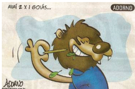
Figura 12. Charge de Adorno.

Somente quando o Leão conseguiu vencer pela segunda vez ao Goiás, na 30ª rodada, por 2x1, é que Adorno ressurge na exaltação ao felino, numa charge pós-jogo que difunde a destreza do animal palitando os dentes para tirar os restos de penas verdes do Periquito recém devorado. O Periquito se concretiza metonimicamente na narrativa, até porque a legenda acima determina melhor a leitura.