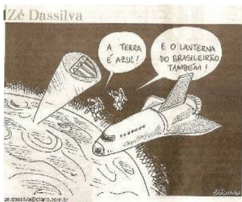
Figura 7. Charge de Zé Dasselva.