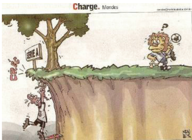
Figura 8. Charge de Mendes.

Depois de vencer o Vitória por 4x0, na 15ª rodada, empatar com o Corinthians, 0x0, na 16ª, e ainda ganhar do Santo André, 1x0, o Leão comemora no alto do penhasco, fazendo embaixadinhas, no traço de Mendes, enquanto observa interrogativo o rival local, despencando da tentativa de acesso à série A.