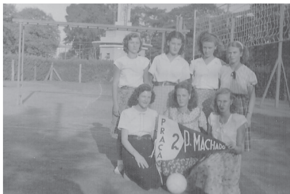
Ilustração 4. Club de Voleibol da Praça nº 2 Pinheiro Machado.