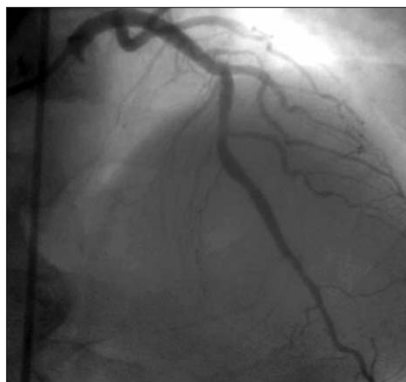
Figura 3 - Angiogramia coronariana após implante de dois stents recobertos de PTFE (JoGraft®).