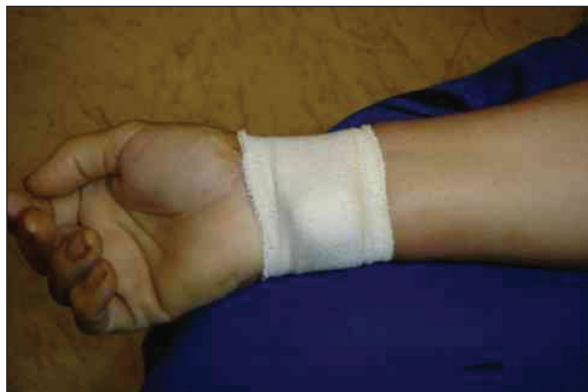
Figura 2 - Curativo compressivo com Tensoplast®.